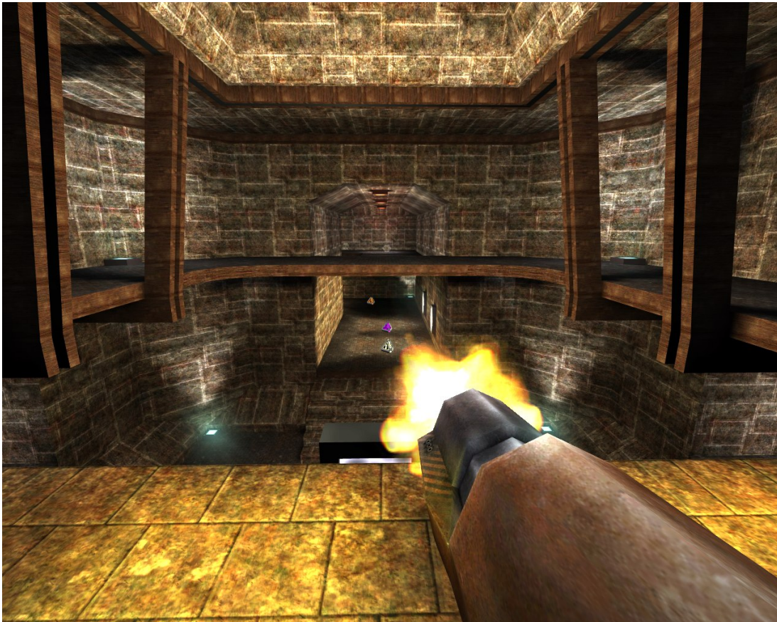
Abbildung 2: Screenshot aus dem Spiel Team Arena, das die Quake 3 Engine verwendet. Durch die Veröffentlichung deren Quellcodes wurde der “fast inverse square root” Algorithmus der breiten Öffentlichkeit zugänglich.

Dabei ist zu beachten, dass es nicht “die” perfekte Magic Number gibt. Es gibt durchaus unterschiedliche Implementierungen, die unterschiedliche Magic Numbers verwenden, die je nach Wert von x unterschiedlich präzise Werte liefern.