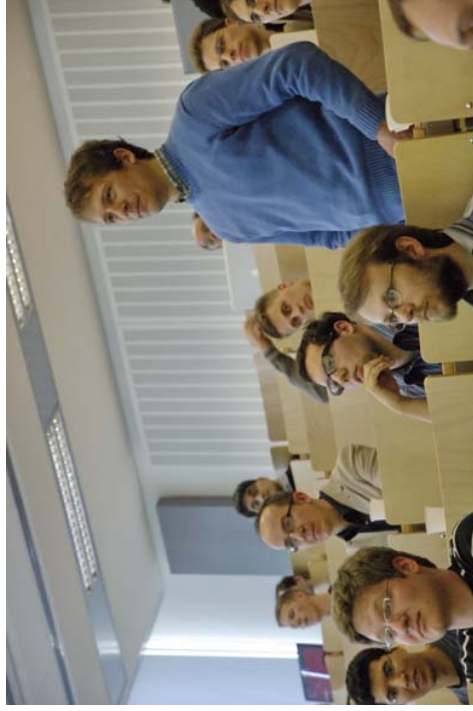
Als Ausgleich für die bis hierher erfolgte geistige Beanspruchung stand für die körperlich fitten Konferenzteilnehmer eine Bergtour auf den Münchner Nockherberg, den Sitz der Paulaner-Brauerei, auf dem Programm.