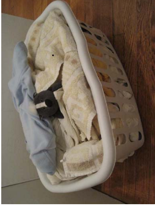
Stinktler Boris im Wäschekorb — damit's anschaulich wird.

Schließlich zu den Stinktieren: die gibt's doch gar nicht in Saudi-Arabien? Nein, natürlich nicht! Also habe ich eins importiert: Boris sein Name, lupenreines Produkt einer Pluschtierfirma, die 2006 dank eines gewissen „Goleo“ (Löwe im Nationaltrikot *g*) noch am Rande der Insolvenz stand. Viel wichtiger: emotional behaftetes Geschenk der Freundin. . .