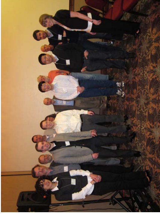
Die Jury und die Finalisten des 3. BGCE Student Paper Prize auf der Konferenz SIAM CS&E11 in Reno.