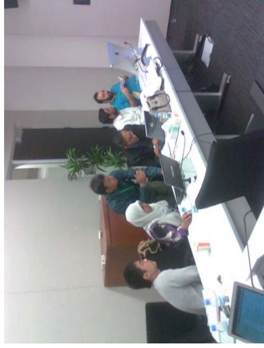
Atmosphäre in meiner Gruppe – auf dem Weg zur Simulation.