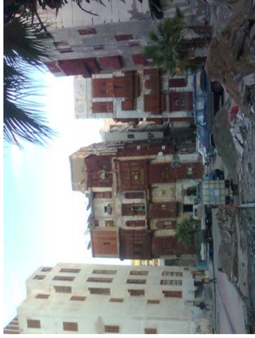
Jeddahs historisches Zentrum – warum wird nicht renoviert?

Im Reiseführer war die Rede von einer historischen Altstadt aus dem 18./19. Jahrhundert, im Unterschied zu anderen Saudi-Städten. Nun gut, die historischen Gebäude und Souks waren existent (man konnte sich leicht verirren!), aber viel Wert auf deren Erhaltung wird offensichtlich nicht gelegt. Dafür gibt es diverse moderne Gebäude und riesige Shopping Malls im ständig wachsenden Jeddah – mit dem „Mile-High Tower“ soll hier auch der höchste Phallus... ääh Wolkenkratzer der Welt entstehen. Man darf gespannt sein auf die Umsetzung dieser veritablen Rakete. Bevorzugte Freizeitaktivität der Saudis in Jeddah ist sinnigerweise das Shoppen. Ich habe mich lieber auf's morgendliche Joggen am Roten Meer konzentriert. Fazit: Jeddah solala, Jeddah Hilton top!