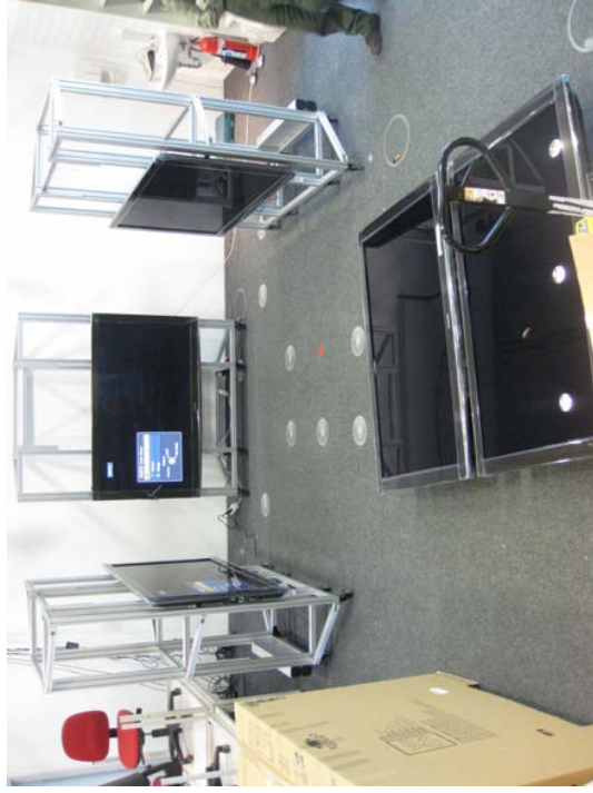
Die Hardware bei der Anlieferung 5 Tage vor der Einweihung.

Als Rahmen für die Eröffnungsfeier der dritten Installation im ITüpfel wurde die Abschlussveranstaltung des äußerst erfolgreichen ASIM-Workshops 2011 in München (siehe separaten Bericht) gewählt. Alle Workshop-Teilnehmer und interessierten Personen der TUM waren herzlich eingeladen, die berühmte und lang angepreisene FRAVE erstmals live zu erleben.