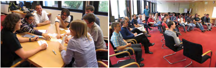
Abbildung 3: „Contracting“ zwischen neuen BGCE Studierenden und Verantwortlichen.

Den krönenden Abschluss des ersten Tages bildete der traditionelle Kaminabend, bei dem ein Gast mit Rang und Namen zu Vortrag und interaktiver Diskussion eingeladen wird. Kenner des Kaminabends wird es auch nicht wundern, dass die Veranstaltung wieder ebenso traditionell ohne echten Kamin, aber dafür diesmal mit einer – wie könnte es bei BGCE anders sein – simulierten Variante abgehalten wurde.