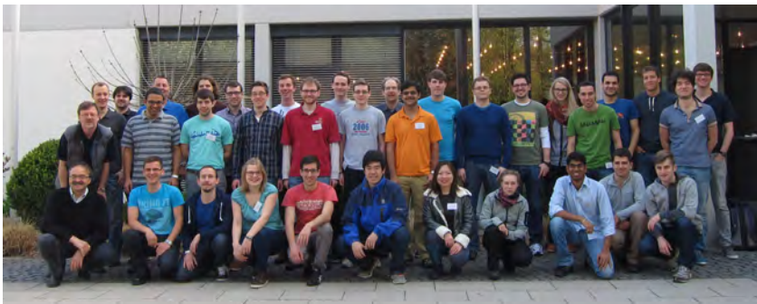
Abbildung 5: Gruppenbild der aktuellen BGCE-Studierenden mit den Professoren und Koordinatoren des ENB-Studiengangs.

Genauso verlässlich wie die Nichtexistenz eines Kamins und die traditionell gute Stimmung war dieses Jahr auch wieder das frühlinghafte Wetter, sodass am Samstag die Softskill-Seminare When Teamwork Works und Step Out für die BGCE Junior- bzw. Senior-Studenten teilweise aufgelockert in freier Natur stattfinden konnten. Gemütliche Gespräche und intensive Diskussionen vor allem abends leiteten bereits ein in den Erfahrungsaustausch zwischen beiden Studentengenerationen, der am Sonntag in moderierter Form als Consulting Circle stattfand. Der Eindruck, den wir bereits bei der Vorauswahl der Kandidaten standortweise hatten, dass es dieses Jahr eine ausgesprochene motivierte und engagierte Truppe Studierender ist, hat sich bisher auch im Zusammenspiel voll bestätigt, und wir freuen uns auf ein erlebnisreiches Jahr BGCE.