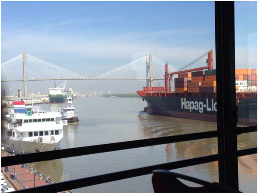
Abbildung 1: Ausblick auf den Savannah River (hier einmal ohne Delphine) aus einem der wenigen Konferenzräume, die Tageslicht aufwiesen und nicht wie die anderen durch die überdimensionierte Klimaanlage in einen künstlichen sibirischen Winter verwandelt wurden.

tis, die relevant sind für Berechnungen der Weltklimaentwicklung und bei denen wesentliche Parameter unsicher oder unklar sind: Die genaue Beschaffenheit des Felsbodens unter kilometerdickem Eis kann – wenn überhaupt – nur an wenigen Punkten mit hohem Aufwand durch Bohrungen ermittelt werden. Indirekte Effekte wie die Bewegungsgeschwindigkeit des Eises an der Oberfläche können dagegen besser gemessen werden.