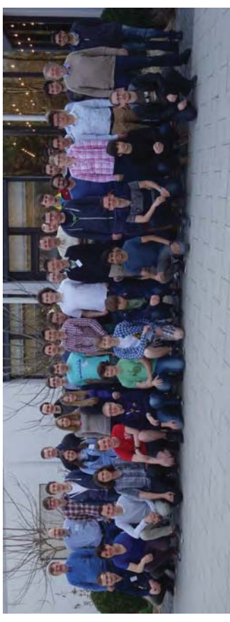
Abbildung 6: Gruppenbild der beiden BGCE-Jahrgänge 2014 und 2015 mit den Professoren und Koordinatoren des ENB-Studiengangs.