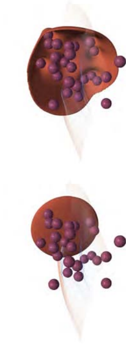
Abbildung 2: Deploying the SL solver

oortree representation of a function is a tree in which at every leaf, the function is represented by the coefficients of its Chebyshev polynomials. In addition, Arash extended the octree code to support dynamic adaptivity to avoid superfluous computations and reduce the computational cost. Figure 1 illustrates the capabilities of the solver for the Zalesak test case. George Biros' research group has developed a parallel solver (PVFMM) for solving the Stokes equation in the unit box based on the volume integral equation formulation. PVFMM is capable of computing the velocity fields of the Stokes flow through complex geometries such as porous media. Figure 2 illustrates an example of deploying the SL solver using the velocity field computed by the PVFMM.