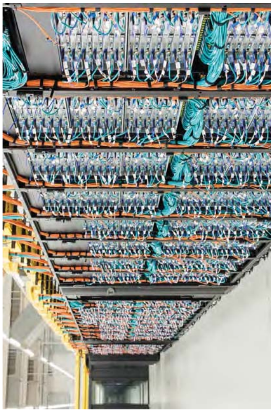
Abbildung 8: Blick in die Erweiterung des SuperMUC am LRZ in Garching bei München. Planmäßig wird die „Phase 2“ aufgebaut und im Frühsommer 2015 in den Betrieb übergeführt.

Am LRZ wird fieberhaft daran gearbeitet, die Phase 2 des SuperMUC in Betrieb zu nehmen. Die Hardware ist praktisch vollständig aufgebaut, s. Foto.