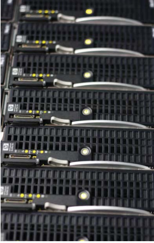
Abbildung 7: Auch hinter der LRZ Compute Cloud steckt reale Hardware, die man anfassen kann.

lichkeit, ihre virtuelle Maschine (VM) mit der von ihnen bevorzugten Systemsoftware (z.B. Ubuntu oder Debian) selbst zu konfigurieren und genießen dann in der VM die vollen root-Rechte.