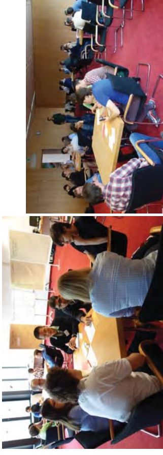
Abbildung 4: „Contracting“ zwischen neuen BGCE Studierenden und Verantwortlichen.

Für die Cloud richtet das LRZ einen intensiven spezifischen Cloud-Support ein. Individuelle fachspezifische Beratung bietet das LRZ über seine „Application Labs“ für die Bereiche Astrophysik, Geo- und Umweltwis-