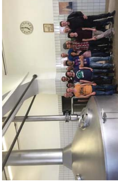
Figure 2: Participants enjoying the guided tour of the Weihenstephan brewery during the social event.