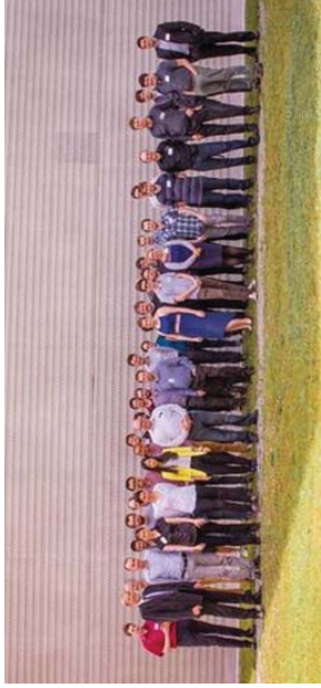
Figure 3: Participants of the scientific workshop “High Performance Computing for Water-Related Hazards” at LRZ, June 29 – July 1, 2016.