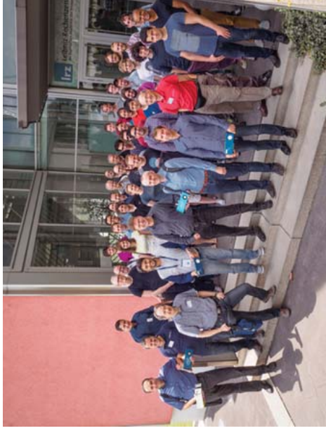
Figure 1: Participants of the “Intel MIC Programming Workshop” at LRZ, June 27–29, 2016. The main speakers in the first row are holding Intel Xeon Phi coprocessors.