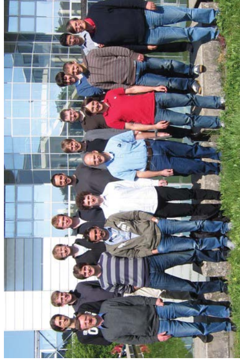
Gruppenbild ohne Dame (?)

Insgesamt hatten sich etwa zehn Studierende – überwiegend aus der BGCE, aber auch COSSE-Studenten und Doktoranden des LSS – für den Kurs angemeldet, wobei drei Teilnehmer aus München und einer aus Stuttgart kamen. Da der Kurs teilweise in der Vorlesungszeit stattfand, wichen wir vom sonst üblichen einwöchigen Modus ab: Wir begannen mit einem zweitägigen intensiven Teil, mit Vorlesungen vormittags und Rechnerübungen nachmittags. Am Ende dieser zwei Tage bekamen alle Kursteilnehmer eine Hausaufgabe, zu deren Bearbeitung sie bis zur Abschlussstunde eine Woche später Zeit hatten. Diese dauerte nur den Vormittag lang und bestand aus der Präsentation der Ergebnisse. Die Aufgaben reichten von der Simulation eines Tsunamis an der indischen Ostküste über die Herleitung numerischer Schemata bis zur Beschleunigung der ANUGA-Software auf Grafikkarten. Es war sehr beeindruckend, welche gute Resultate die Studierenden trotz der kurzen Einarbeitungszeit erreichten, und auch, welche umfangreiche Berichte einigte schrieben.