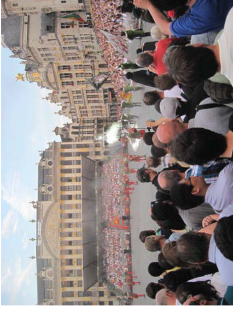
Eine Vorführung beim Ommegang am Grand Place in der Innenstadt Brüssels.

Sicherheit sagen, dass das meistverwendete Wort – wer hätte es geahnt – „Mul-ti-bo-dy“ war.