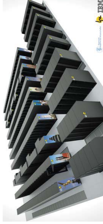
Abb. 2: Eine Simulation des SuperMUC (von IBM)

gang von der SGI Altix 4700 auf den SuperMUC ebnen soll. Wenn dieses Quartal erscheint, sollten die ersten Wissenschaftler schon ihre Programme zum Laufen gebracht haben. Das Migrationssystem erhielt den Namen „SuperMIG“. IBM hat eine Insel mit 205 „fetten Knoten“ geliefert, die auf je vier Intel Westmere-Prozessoren mit jeweils 10 Cores mit 256 GBytes Hauptspeicher basieren und über QDR (quad data rate) Mellanox Infiniband vernetzt sind.