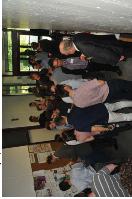
Rege Diskussionen in der Kaffeepause

Mit 62 Registrierungen war das Symposium trotz Brückentag diesmal