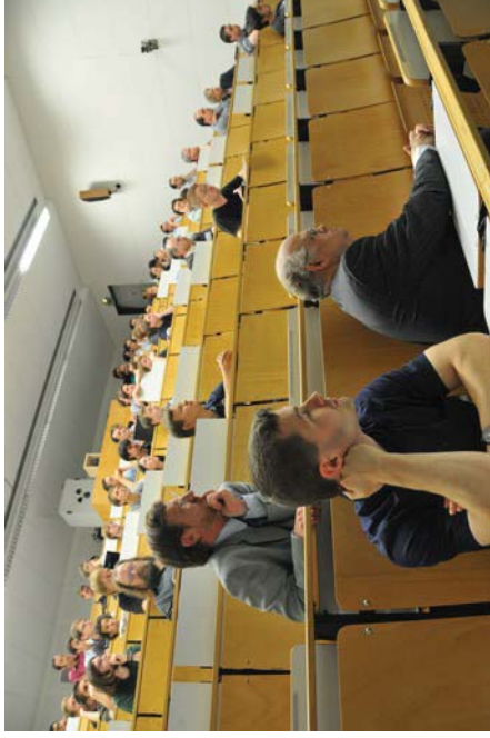
Gespannte Aufmerksamkeit bei den Teilnehmern des EIHEC-Symposiums

Erlanger Universität, soll zukünftig als Kompetenzzentrum der Universität Erlangen-Nürnberg im Bereich des Scientific Computing dienen.