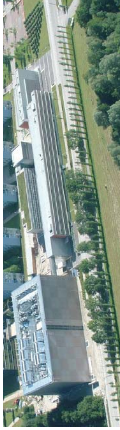
Abb. 1: Luftaufnahme des LRZ im Juli 2011

Wenn der SuperMUC Mitte nächsten Jahres läuft, werden der Staub, den der Bau aufgewirbelt hat, sich gelegt und die Nebel, die der Herbst über die Installation legen wird, sich gelichtet haben. Dann wird es noch viel mehr erfreuliche Neuigkeiten geben.