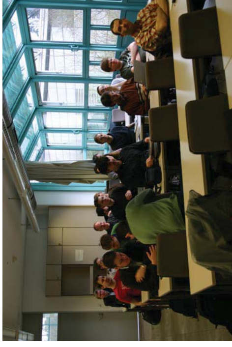
Der Kursraum für den GPU-Computing Workshop am Lehrstuhl für Systemsimulation

Überblick über weitere GPU-Projekte innerhalb des ZISC bekommen haben.