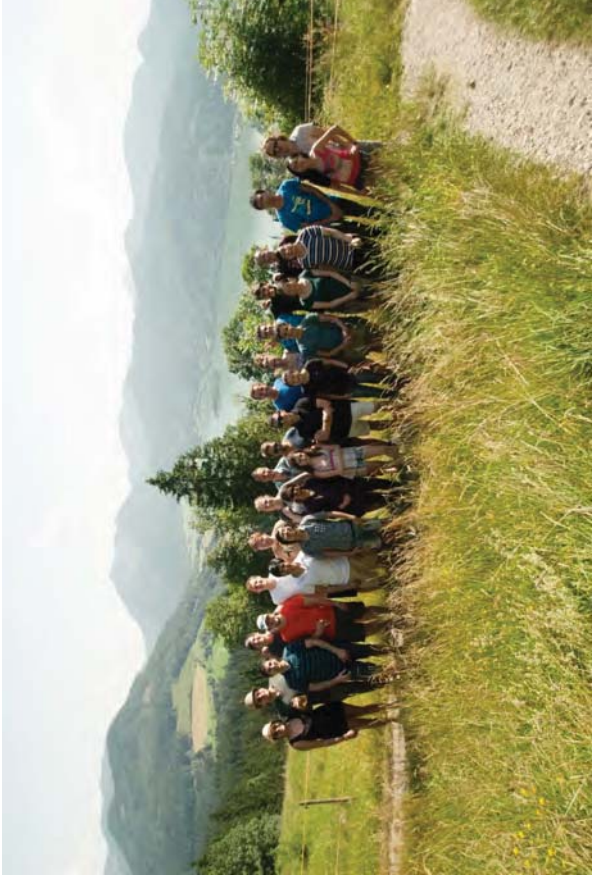
Abbildung 8: Overlooking the Schliersee from Schliersbergalm.