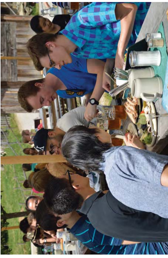
Abbildung 7: Replenishing energy reserves.