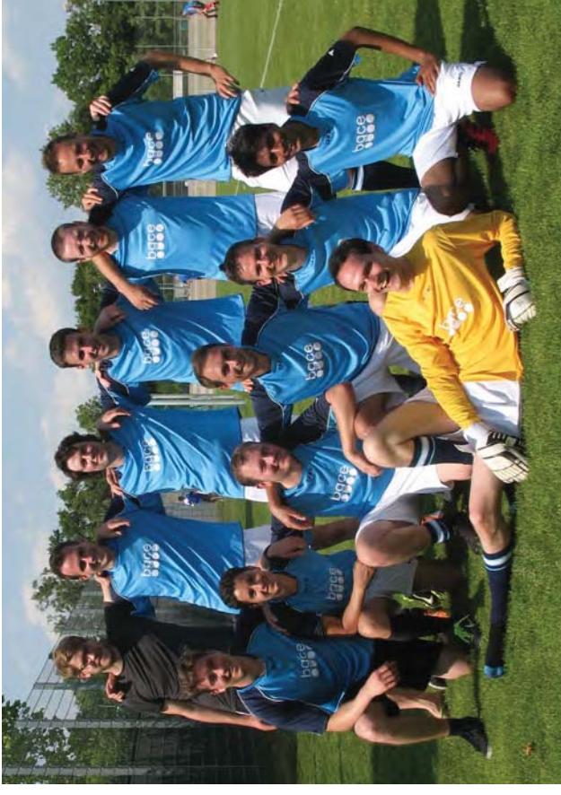
Abbildung 5: Das BGCE-Team von 2015.