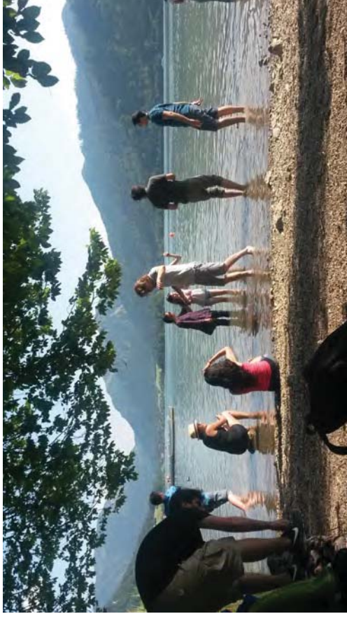
Abbildung 9: A well deserved dive into the Schliersee.

Also bitte keine Volksbefragungen zu so heißen Eisen. Vielleicht erschließt sich ja Spieltheoretikern oder Machtpolitikern, was die griechische gebracht haben mag. Jedoch geht es hier um eine politische Aufgabe. Dafür haben wir Politiker gewählt, mit Entscheidungsgewalt, Macht, ausgestattet, und dafür bezahlt der berühmte Steuerzahler sie. Also mögen sie bitte ihren Job tun, wie auch wir erledigen den unsrigen. Und nach allem, was man so sieht, kann man unserer Gilde zumindest eines nicht absprechen: Einsatz, Fleiß, Leidenschaft und guten Willen bis weit jenseits die Grenze der Be-