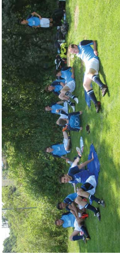
Abbildung 6: Die Spieler bei der immens wichtigen Regeneration :-).

zweimal das Aluminium des gegnerischen Tores zitterte, erhielten wir allerdings äußerst unglücklich ein Gegentor. Da jedes Spiel nur 15 Minuten dauerte, war uns ein Ausgleich leider nicht mehr vergönnt. Und kurz danach gleich der nächste Schock: Es wurden auch keinerlei Platzierungsspiele vorgenommen... Da blieb der Mannschaft nur noch die Rolle des kritischen Beobachters beim erkämpften Finalsieg von FIM aus Augsburg gegen die Max-Weberianer.