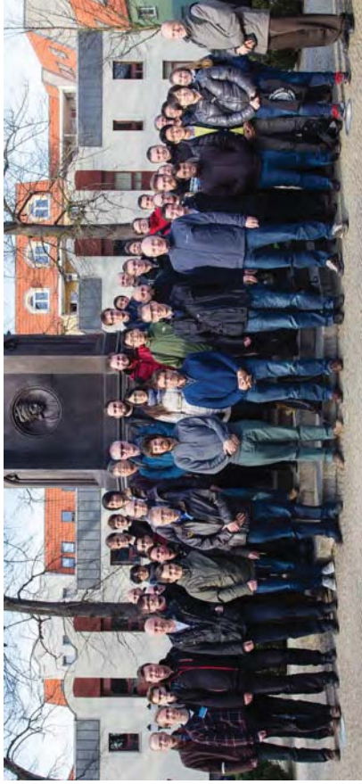
Abbildung 4: Teilnehmer des Workshops „Sparse Solvers for Exascale“