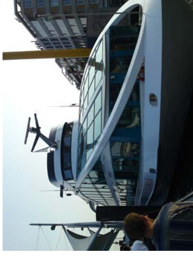
Hafenrundfahrt in Rotterdam

großzügig genug gestaltet, dass man mit alten und neuen Bekanntschaften ausreichend plaudern konnte. Die Welcome Reception fand im schön angelegten Botanischen Garten der TU Delft statt. Beim Conference Dinner in gepflegter Atmosphäre auf dem Schiff durch den Rotterdamer Hafen gab es neben diversen Meeresfrüchten auch „internationale“ Genüsse wie Rindfleisch Stroganoff und Kassler.