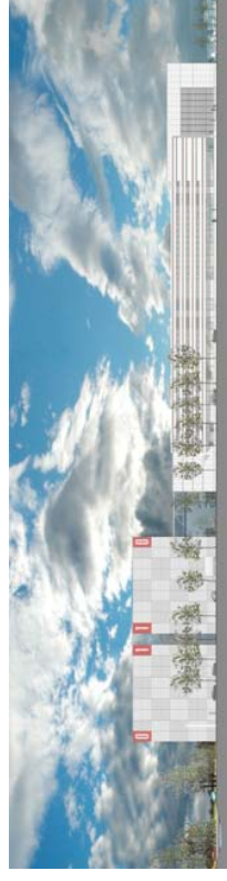
Im Postkarten-Look – Dramatischer Weiß-Blau-Himmel: die Südsicht des LRZ nach Fertigstellung 1