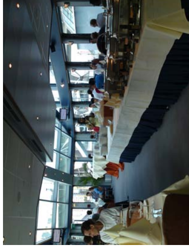
Conference Dinner auf dem Schiff