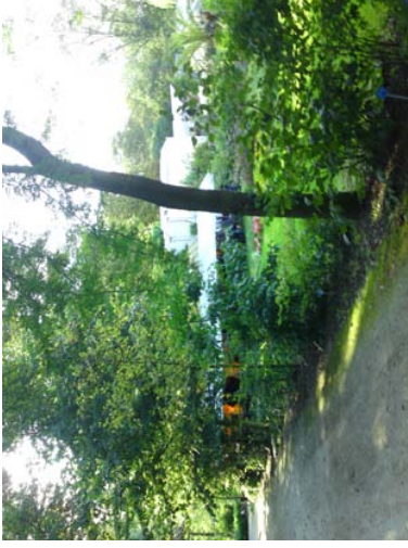
Botanischer Garten von Delft