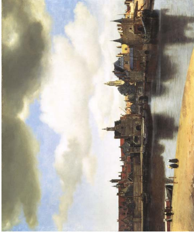
Vermeer „Ansicht von Delft“: Wikipedia

Bereits die 9 Workshops, die vor dem offiziellen Beginn der Konferenz abgehalten wurden, ließen erkennen, dass die Euro-Par ein sehr breit gefächertes Themenspektrum bietet. Neben „Highly Parallel Processing on a Chip“ und Programmieren für heterogene Plattformen ging es auch um Grid Economics, P2P-Netzwerke und Real-time Online Interactive Applications. Außer dem schon (zu)viel zitierten Gesetz von Moore machte sich in einer Panel-Diskussion die Frage „Are Many-core Computer Vendors on Track?“ breit, welche (wie zu erwarten war) sehr kontrovers diskutiert wurde. Am Eröffnungstag durfte nach der Begrüßung durch Henk Sips dann auch gleich Michael Perrone, Leiter der Abteilung für MultiCore-Programmierung im