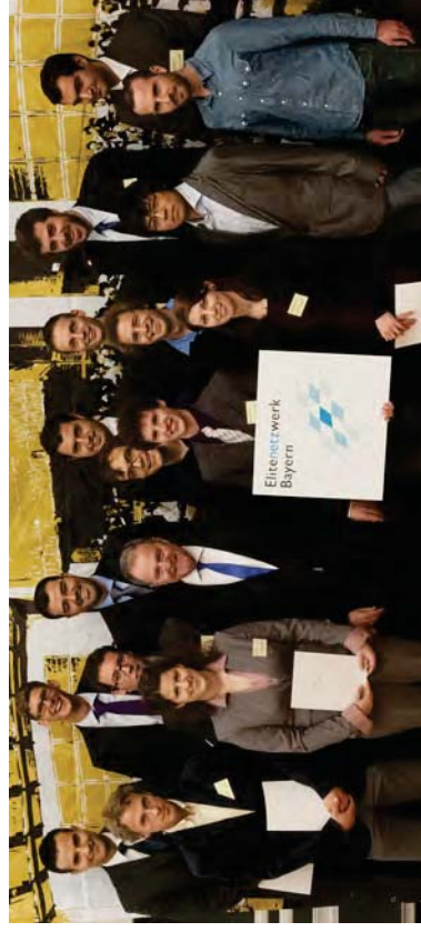
BGCE-Absolventen mit Minister Heubisch bei der Übergabe der ENB-Zertifikate

Am 30. November 2012 fand die Absolventenfeier des Elitenetzwerks Bayern (ENB) statt, diesmal an der TU München in Garching. Und natürlich war die Bavarian Graduate School of Computational Engineering (BGCE) bei diesem Heimspiel nicht nur wieder vertreten, sondern unsere „jungen“ Studierenden haben auch fleißig mit angepackt, damit diese Großveranstaltung mit ca. 700 Gästen würdig stattfinden konnte.